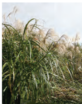
茶草場に生えるのは主にススキやササ。秋の七草や固有種のバツタなど、茶草場には貴重な自然がいっぱい

また、定期的に人間が草刈りをするので草が維持されるので、いろんな虫や植物の棲み処にもなっています。おいしいお茶づくりを通して人間と自然が共生することから、世界農業遺産に認定されました。