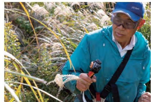
茶草の管理は環境維持に大切な役割を担っています。農家の活動が里山の自然を守っているんです。

一般受付に先駆けて2018年の11月下旬、実際の作業現場を見学させてもらいました。そこには驚きがいっぱい。土のことや植物のこと、肥料にまつわる化学の知識…などなど、農家さんの知識はすごい。自然の中でいかにおいしいお茶をつくり上げていくか。畑仕事はまさに自然との対話です。「うちで昔からやっている方法へ